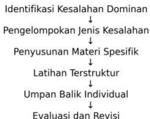
Gambar 2. Skema Desain Modul Remedial Berbasis Kesalahan

Skema ini menunjukkan bahwa kesalahan mekanis dan struktural saling berkaitan dan membutuhkan pendekatan remedial terpadu.