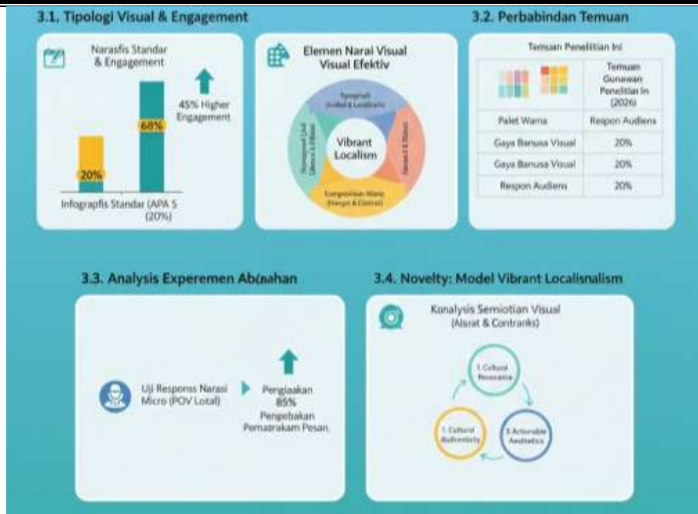
Gambar 2. Hasil Analisa

Perbedaan ini menunjukkan bahwa dalam konteks kampanye sosial (bukan komersial), audiens mencari "kejujuran visual" yang dekat dengan realitas mereka. Analisis tambahan menunjukkan bahwa penggunaan caption pendek yang didukung oleh gambar yang memiliki "kekuatan bicara" (metafora visual) mampu memotong hambatan skeptisisme informasi (Gunawan 2023).