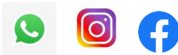
Gambar 3. Sosial Media Pemasaran

Selain dalam pemberian label pada produk rengginang yang bertujuan untuk upgrading produk UMKM, mahasiswa KKN juga mempromosikan usaha UMKM rengginang ini melalui media sosial, seperti Facebook, WhatsApp, Instagram. Hal ini dilakukan untuk mengenalkan produk Ibu Rahayu kepada masyarakat luar Kepulauan Bangka Belitung