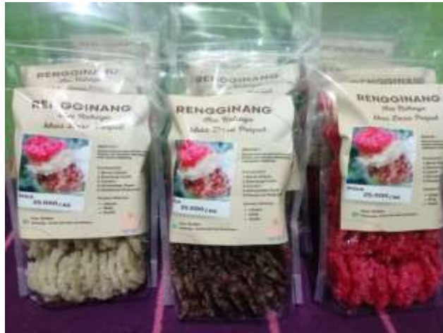
Gambar 2. Label Produk UMKM Rengginang

Selain dalam pemberian label pada produk rengginang yang bertujuan untuk upgrading produk UMKM, mahasiswa KKN juga mempromosikan usaha UMKM rengginang ini melalui media sosial, seperti Facebook, WhatsApp, Instagram. Hal ini dilakukan untuk mengenalkan produk Ibu Rahayu kepada masyarakat luar Kepulauan Bangka Belitung