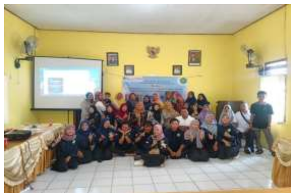
Gambar 4. Sosialisasi Produk UMKM

Mahasiswa memberikan pengarahan kepada masyarakat desa perpat khususnya ibu PKK mengenai pengembangan UMKM yang ada di desa, mulai dari kemasan, pemberian label pada produk, serta pemasaran yang menjadikan produk UMKM desa bisa dikenal masyarakat luas.